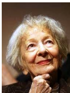
Wisława Szymborska (1923 – 2012)