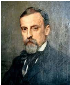
Henryk Sienkiewicz (1846 – 1916)

Warto również przypomnieć o 4 poprzednich naszych noblistach z literatury