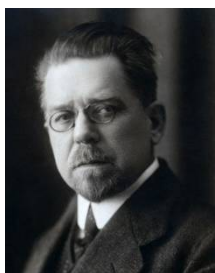
Władysław Reymont (1867 – 1925)